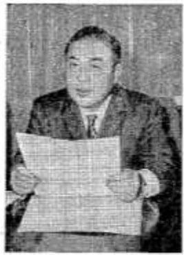
二つの水俣病被害事件の公害認定で 政府はまずこの認定方針